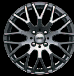
Black Metal Coat