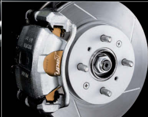
Brake Pad & Brake Rotor