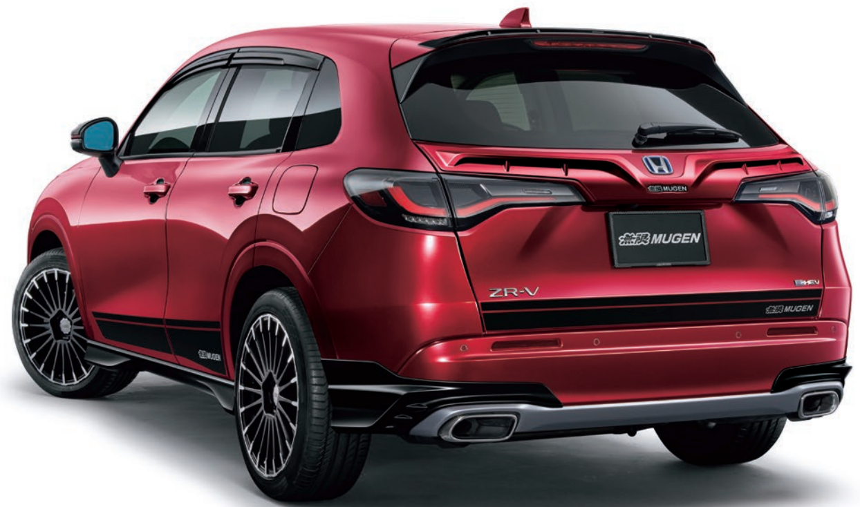
Photo:e:HEV Z (FF) ボディーカラーはプレミアムクリスタルガーネット・メタリック 装着ホイールはMDC テールゲートガーニッシュは未塗装を塗装して装着